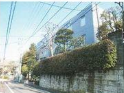
外観 (平成22年2月撮影)