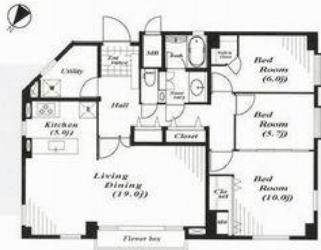
心図面と現況が異なる場合は現況優先となります。